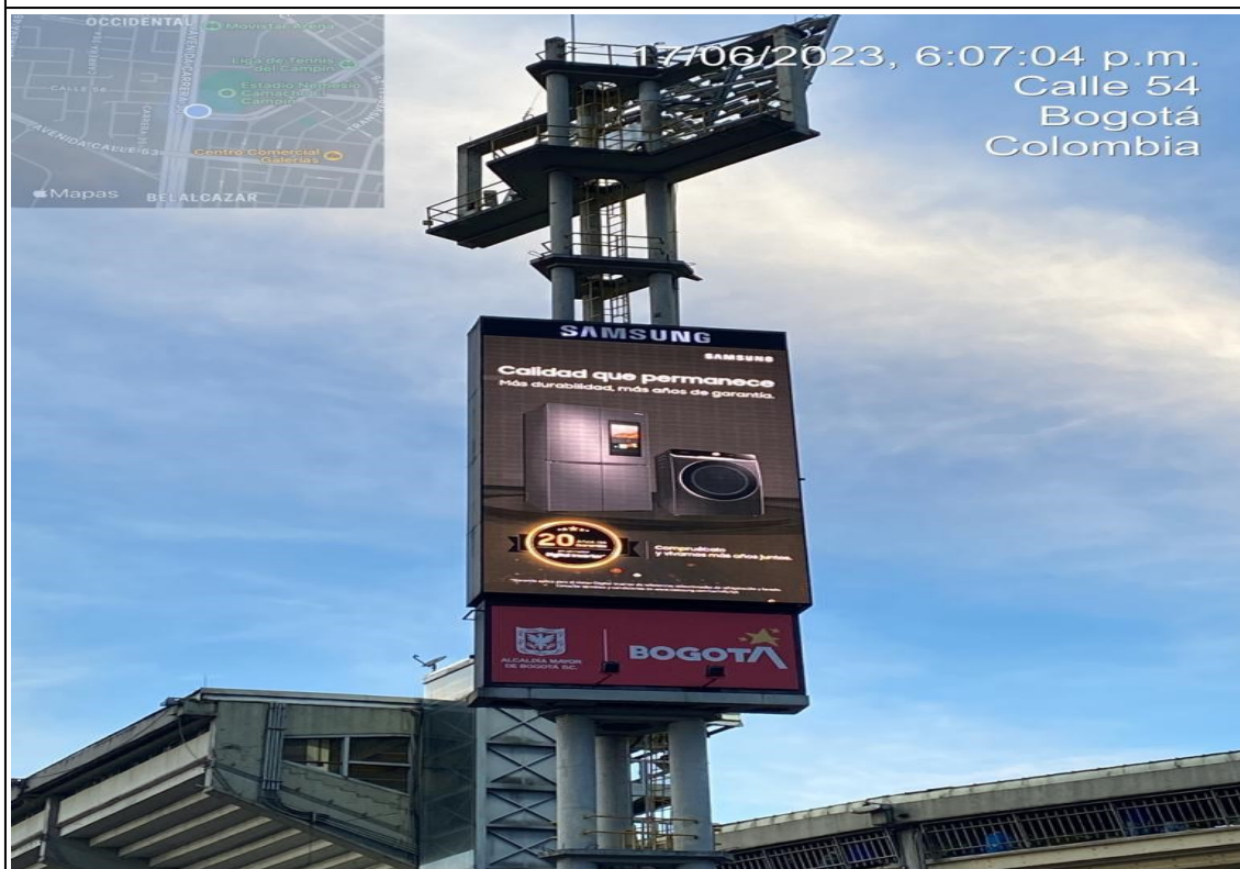
Vista panorámica del elemento identificado